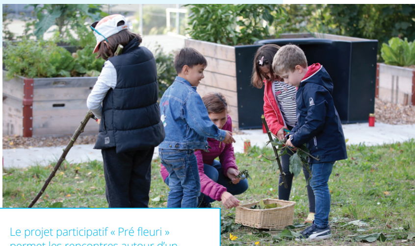
Le projet participatif « Pré fleuri » permet les rencontres autour d'un jardin ouvert à tous.

Ville totalisaient 294 places. A la rentrée scolaire 2020-2021, le nombre de places se montait à 499 (+70 %), tous les établissements primaires bénéficiant de ces augmentations de capacité. Ce sont aujourd'hui plus de 27 % des élèves scolarisé·e·s au primaire qui fréquentent l'accueil extrascolaire.