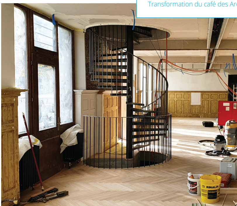
Transformation du café des Arcades

Les deux actionnaires entendent poursuivre leur collaboration en vue de continuer à développer ce quartier, qui constitue une plus-value évidente pour la collectivité.